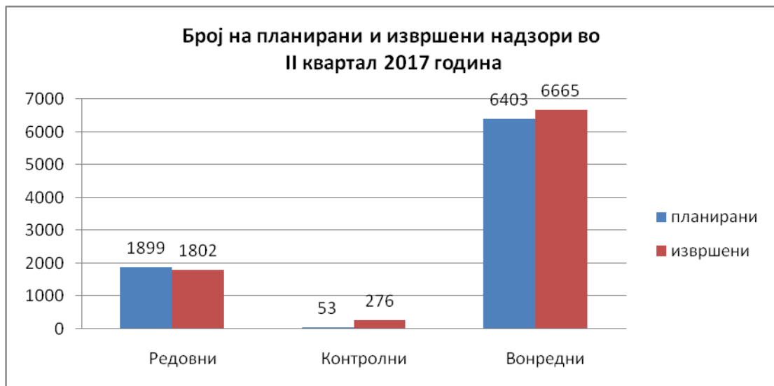
Графикон бр.6 Приказ на број на планирани (редовни, контроли и вонредни) и број на извршени (редовни, контроли и вонредни) надзори.

Согласно кварталниот извештај за работа (Образец бр.1, Образец бр.2, Образец бр.3, Образец бр.4, Образец бр.5 и Образец бр.6) и од извршената анализа може да се заклучи дека најголем број на планирани надзори се однесуваат на законските прописи кои се во 4 ниво на закони, односно по степенот на сложеност (Q 10, Q 11 и Q 12) со вкупно испланирани 4928 надзори или 59% во однос на вкупните планирани надзори (8355) за II квартал 2017 година.