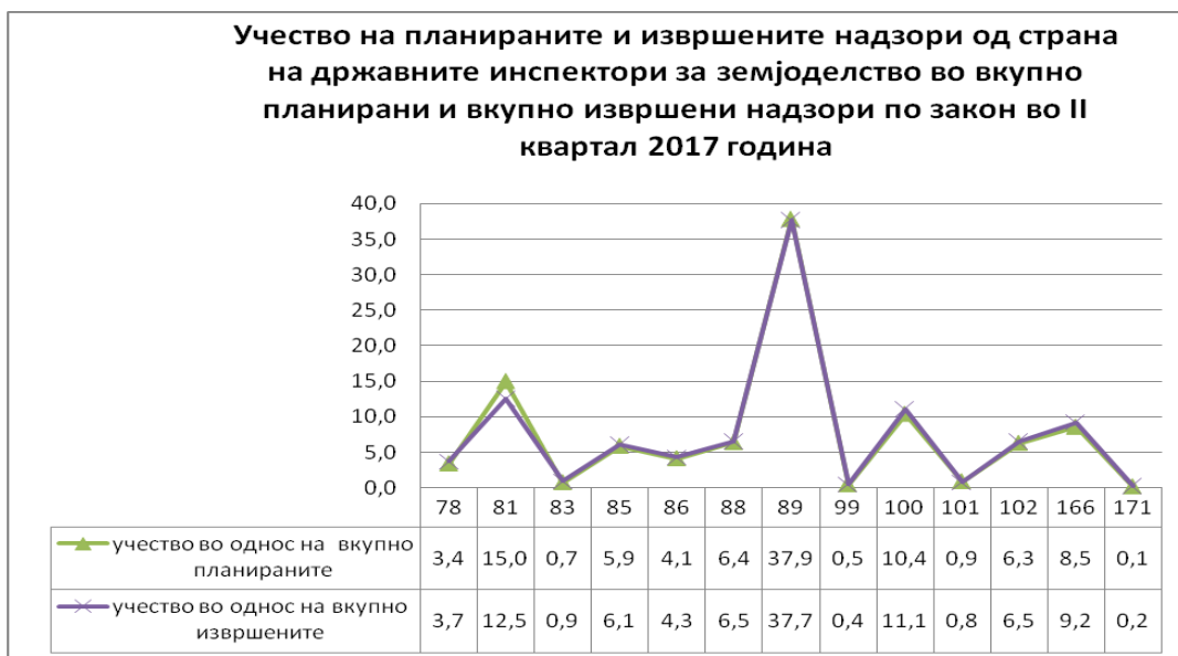
Графикон бр.2 Број на извршени надзори според закони од страна на државните инспектори за земјоделство изразено во % во однос на вкупниот број на надзори за II квартал 2017