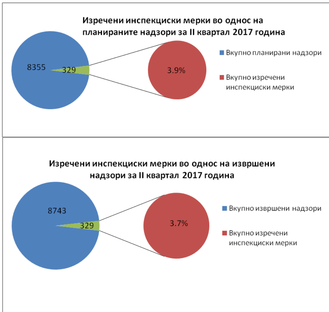
Графикон бр.4 и 5 Приказ на број на планирани надзори во однос на донесени инспекциски мерки, и извршени надзори во однос на истите донесени мерки