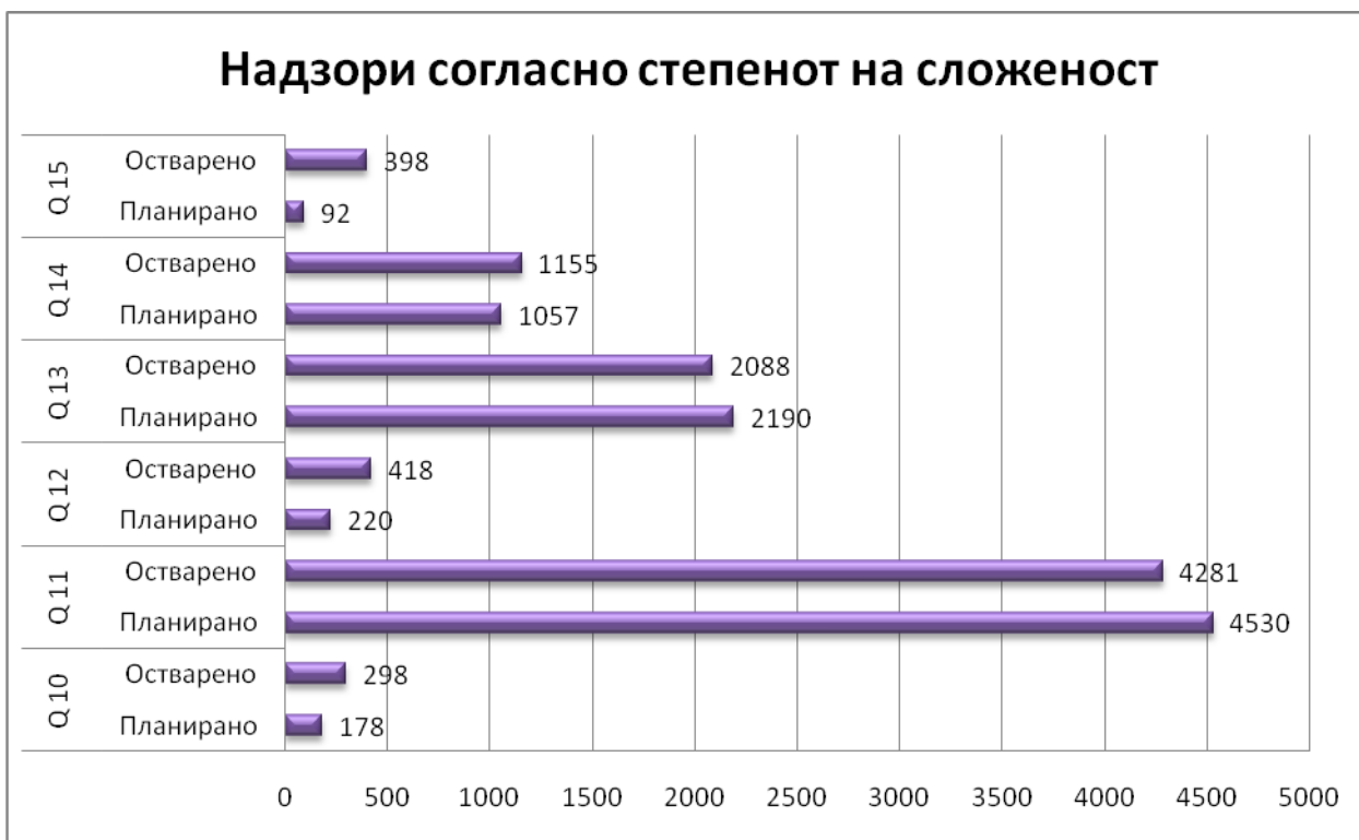
Графикон бр.7 Приказ на планирани и остварени надзори согласно степенот на сложеност за I квартал 2017 година