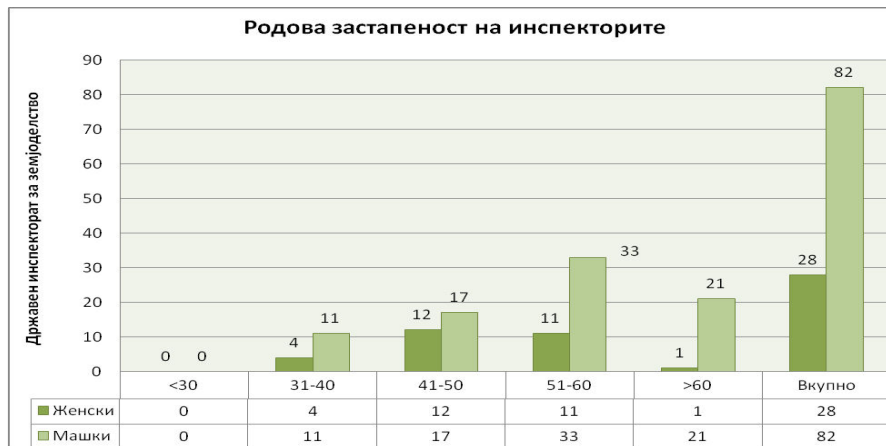
Графикон 1 Преглед на бројот на инспектори кои вршеле инспекциски надзор во полугодието, по родова застапеност и возраст