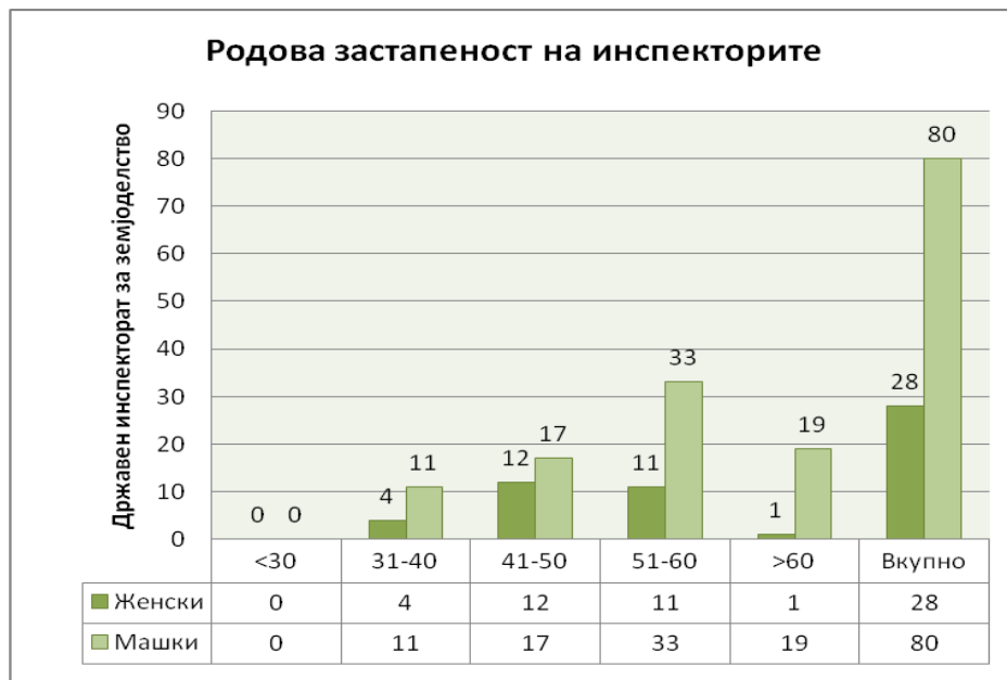
Графикон 1 Преглед на бројот на инспектори кои вршеле инспекциски надзор во полугодieto, по родова застапеност и возраст